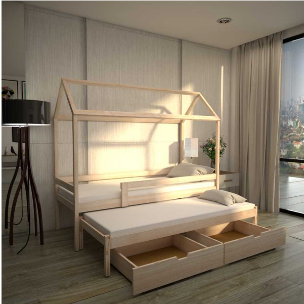
???? ??? ????????

??????? ?????? ?????????????? Domik -11-VKY ??? ????? ? ????????????? ?? ??????? ??????