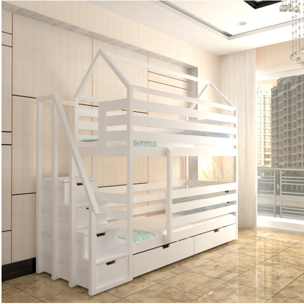
???? ???? ?????????

???????? ?????????????? ? ???? ?????? "DOMIK-2 -D1-LKP", ????????????? ?? ??????? ??????. ??? ????? ? ?????????? ??????? ? ???????? -2300??, ?????????? ????? ??????? (?? ????? ?? ?????) 900??, ?????? ?????????? 450??