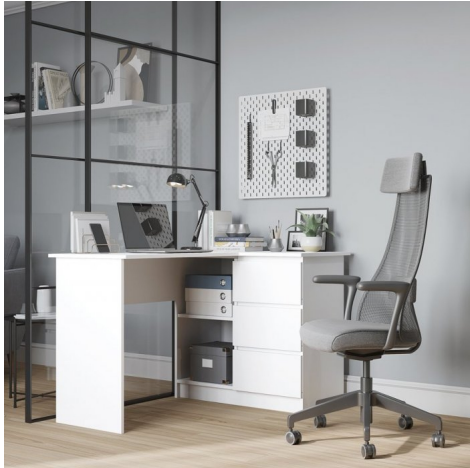
???? ??? ????????

C??? ?????????? Modern-4 ??????? ?? ??????? ?????? ? ?. ?????? ??????