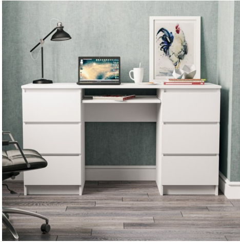
???? ??? ????????

C??? ?????????? Modern ? ????? ??????? ?????????? ?? ??????? ????? ? ?? ????? ??????