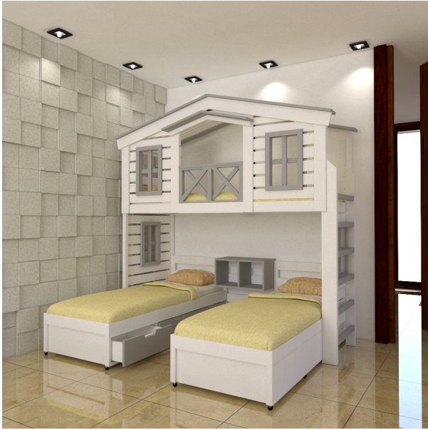
???? ??? ????????

???????? - ????? ????????????? ? ????? ?????????? ??????? Sonya-23D4-LCHW ??? 3 - ??? ????? ? ?????????? ? ??????? ????? ( ?????? )